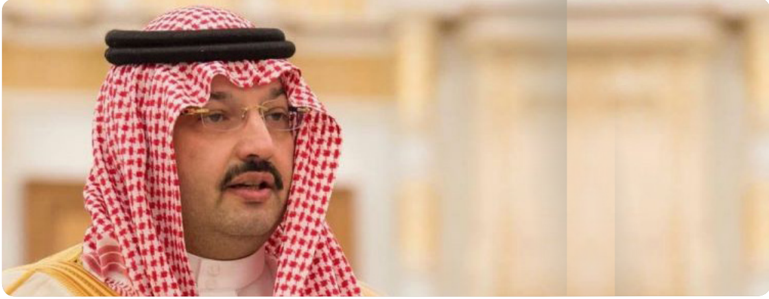
صاحب السمو الملكي الأمير تركي بن طلال بن عبد العزيز آل سعود أمير منطقة عسير

التقدم والرقى في الوطن يصنع بأيدي أبنائه المخلصين بتقديم ما بوسعهم من جهود للتطوير في ظل الرؤية الثاقبة من لدن القيادة الحكيمة لرفعة الوطن ورقية.